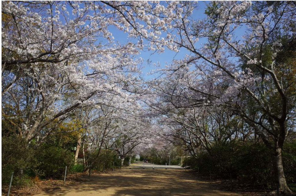
桜 (海上八幡宮)